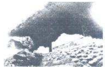
Cubierta protectora en el edificio C de Topoxte.