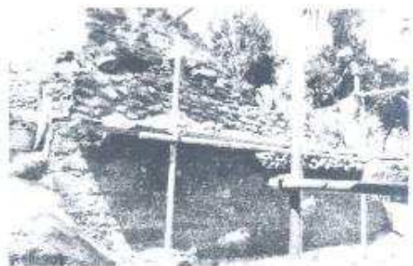
Esquina sur este del cuarto nivel